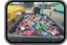
Les flux valorisables