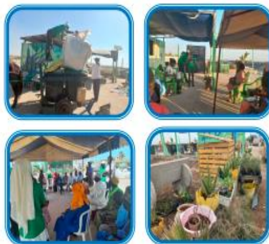
Les formations aérées pour les populations sur les modules liés aux changements climatiques et la généralité des déchets