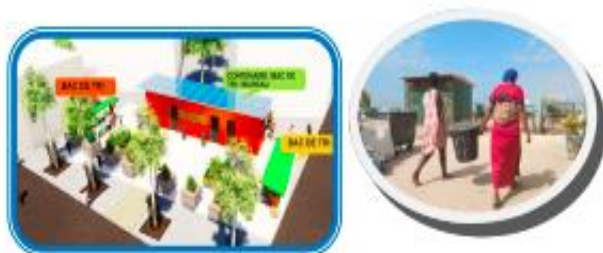
Plan global d'une Zone Ecologique Communautaire alimentée par une énergie renouvelable

Dans cette dynamique, la Commune va élaborer un plan d'action pouvant favoriser le développement du processus de préservation du cadre de vie. Ces réalisations d'Eco centre (ZEC) rentrent dans la charpente technique de valorisation des déchets.